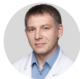
Шестопалов Евгений Юрьевич министр здравоохранения Приморского края, к.м.н., врач анестезиолог-реаниматолог